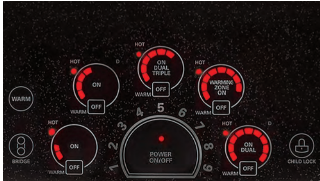
Commandes SmoothTouch MC LCE3681