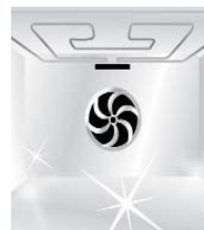
Fácil de limpiar