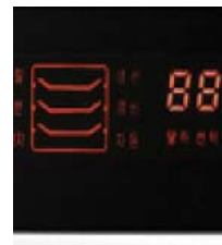
Fácil de manejar