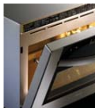
Libre instalación o encastrado