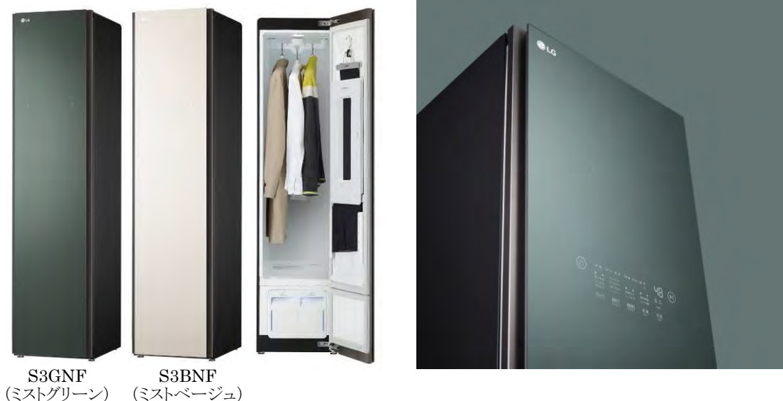
S3GNF (ミストグリーン) S3BNF (ミストベージュ)

もちろん、「LG Styler」には欠かせない除菌機能においても、菌やウイルス、花粉を 99%以上低減します。衛生意識が高まる昨今、「衣類の除菌」を通して家族の健康を守れる家電として、みなさまの生活に寄り添います。