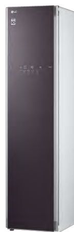
「S3CW」 (メタリックチャコール)