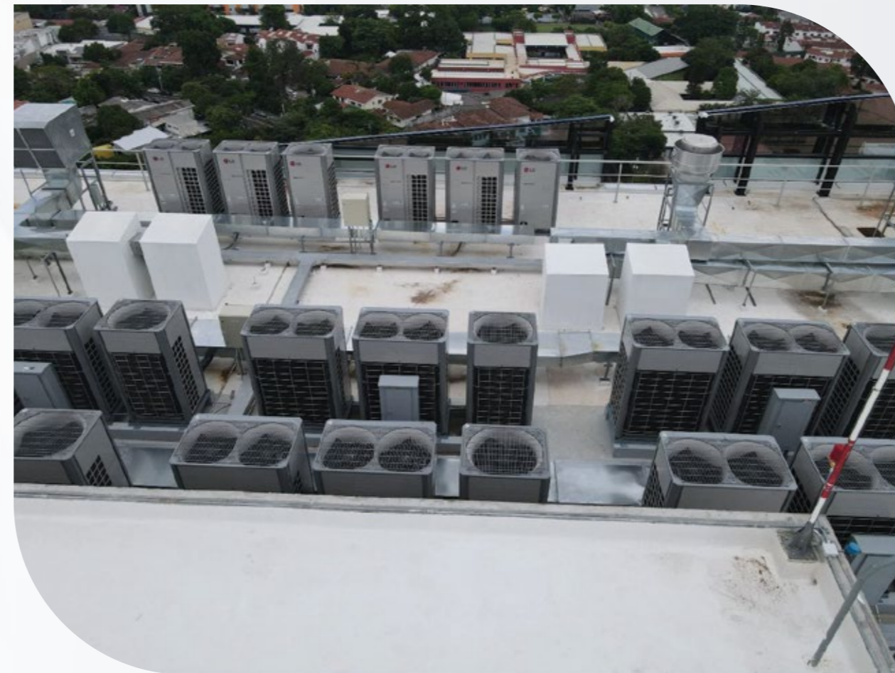
Ilustración 1 Edificio Torre Humana, San Salvador, El Salvador.

LG Electronics junto con su aliado comercial Grupo Euroaires en El Salvador, presentaron un ambicioso proyecto de climatización e integración a un sistema BMS (Building Management System) para un moderno centro médico de oficinas privadas, que se extiende a lo largo de 20 niveles. De estos, los niveles 1 al 8 están destinados a estacionamientos, equipados con un sistema de extracción e inyección de aire controlado por sensores de CO2, garantizando así un ambiente saludable y seguro para los usuarios. En el nivel 9, se encuentran las terrazas y áreas comunes, mientras que del nivel 10 al 20 se ubican las oficinas médicas, todas climatizadas con equipos de aire acondicionado LG . La gestión de estos sistemas se realiza a través del Becon Manager , un sistema de control centralizados ACP 5 , que permite un monitoreo eficiente y automatización en tiempo real de todas las unidades.