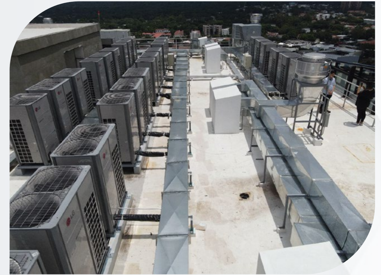
Ilustración 1 Edificio Torre Humana, San Salvador, El Salvador.

El edificio cuenta con una construcción de 35,000 m 2 y está equipado con 196 unidades LG VRF , que incluyen tanto unidades de ducto como de cassette de 4 vías y 1 vía, adaptándose a las necesidades específicas de cada espacio.