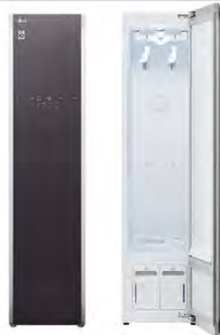
S3CW (メタリックチャコール)