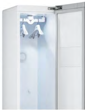
シンプルケアモデル