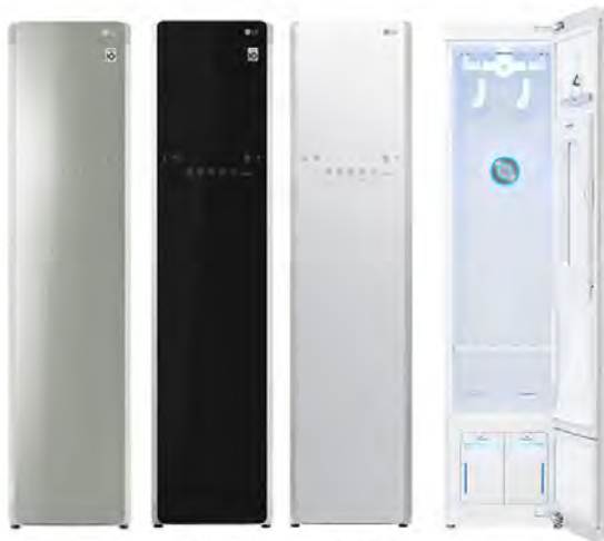
S3MF (ミラー) S3BF (ブラック) S3WF (ホワイト)