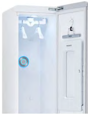
トータルケアモデル

トータルケアモデルの扉裏にあった「ズボン折り目ケア」をなくして、庫内照明もよりシンプルに。庫内の小物を置く「棚」も別売りにするなど、コストを抑えながらデザインを見直しました。